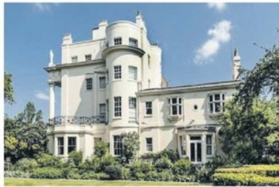
De villa van Damien Hirst in Londen. Kosten: 48 miljoen euro.

Dat het veel grootser kan, is de afgelopen jaren gebleken. In de duurder straten is het een komen en gaan van graafmachines, betondraaiers en loodgietersbusjes voor de bouw van onder-